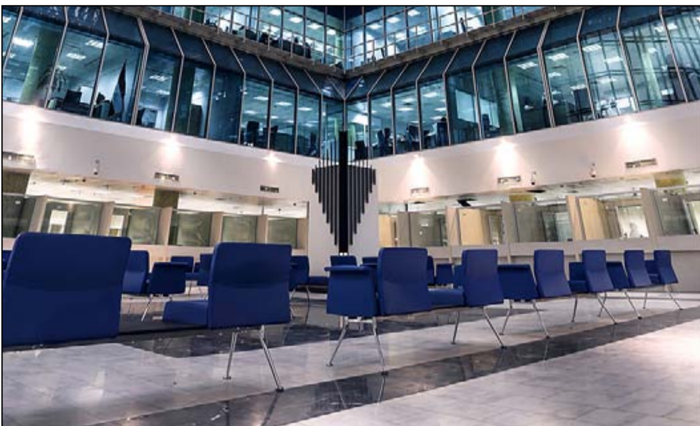
قاعة داخل البنك المركزي

وأضاف الخبير الاقتصادي ل(المدى) إن "البنك المركزي بدأ ينفذ برامج من شأنها تطوير القطاع المصرفي وأبرزها نظام المقسم الوطني والحساب المصرفي الدولي". وتابع ان "البنك المركزي عليه تشديد الرقابة على عمل القطاع المصرفي بهدف تجنب الهفوات التي تحصل في المصارف وعدم الإضرار بسمة القطاع المصرفي".