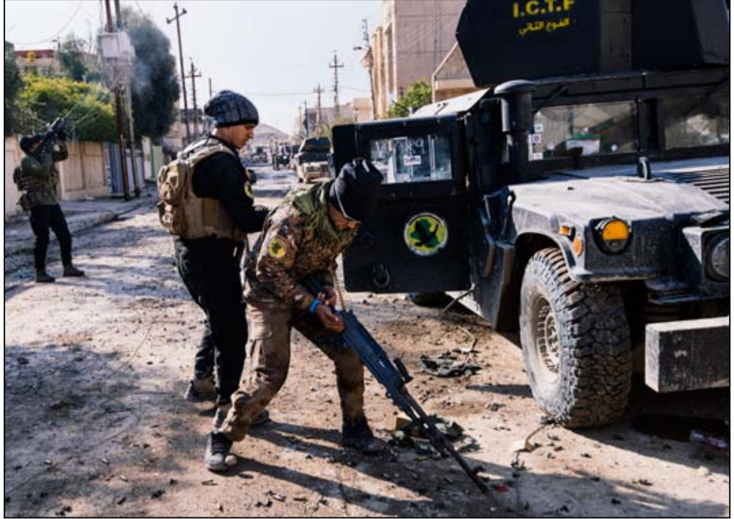
قوة عسكرية في حي الميثاق...

بالموازنة في المحورين" في جنوب شرق الموصل. وتابع "نحن نسير جنباً إلى جنب بتوقيت زمني والمسافة في نفس المستوى. وهذا حقيقة عامل مهم لم يستطع التنظيم من خلاله أن يقوم بعمليات مناورة لنقل مقاتليه وإسناد محور على حساب محور آخر." وأضاف "استنزفنا التنظيم الإرهابي في هذا النوع من التقدم." والتقى قادة كبار في جهاز مكافحة الإرهاب يوم السبت في موقع مؤقت في شرق الموصل حيث بدأت الحياة تعود ببطء إلى طبيعتها في المناطق التي استعادت من تنظيم داعش برغم الدمار الكبير الذي لحق بالمنزل والبنية التحتية.