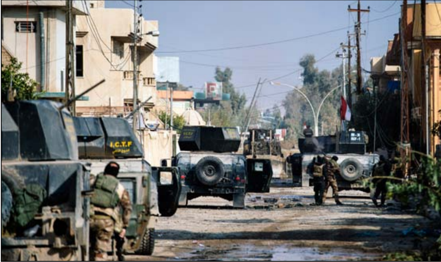
قوة عسكرية في حي الرافق شرقي الموصل.. ا ف ب

أكد قادة جهاز مكافحة الإرهاب، أمس، قرب سيطرة القوات المشتركة على كامل الساحل الأيسر لمدينة الموصل. وتقاتل قوات عراقية أبرزها وحدات مكافحة الإرهاب، منذ اسابيع، تنظيم داعش في الجانب الايسر من الموصل، في إطار عملية استعادة ثاني اكبر المدن العراقية.